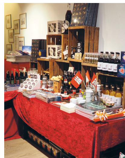
Impressionen aus dem Leuchtfeuer Benefiz Shop 2019